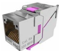
Rys. Złącze RJ45 STP keystone

W gniazdach przyłączeniowych należy zastosować moduły RJ45 BC keystone, które będą zapewniać: