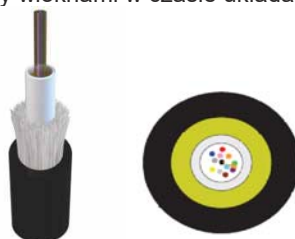
Rys. Kabel światłowodowy