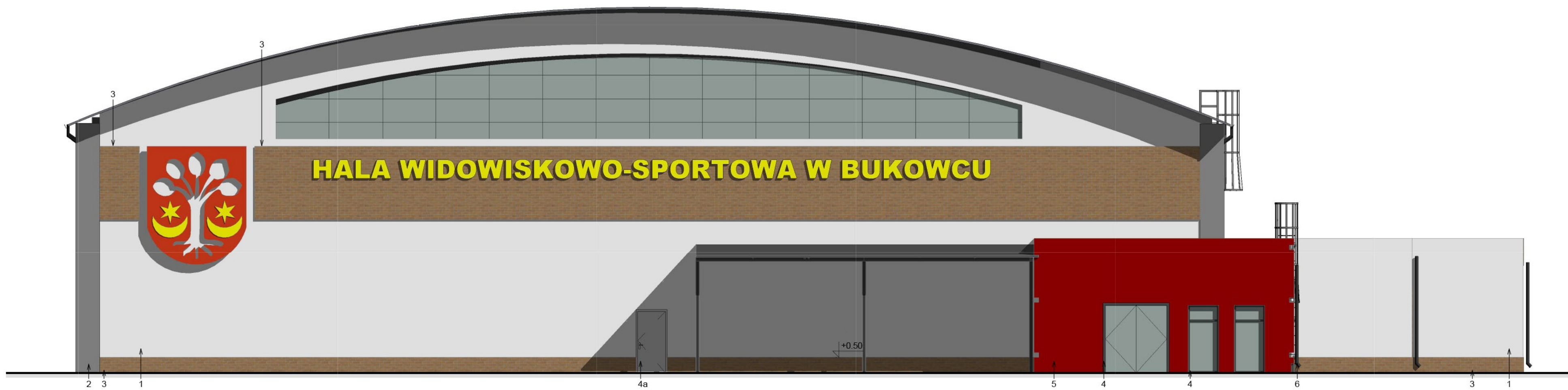
Elewacja pn.-zach. 1 : 100