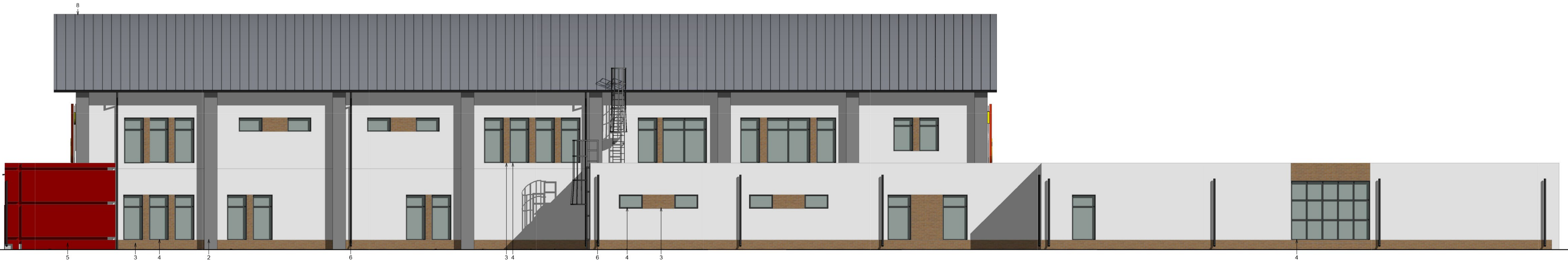
Elewacja pd-zach. 1 : 100