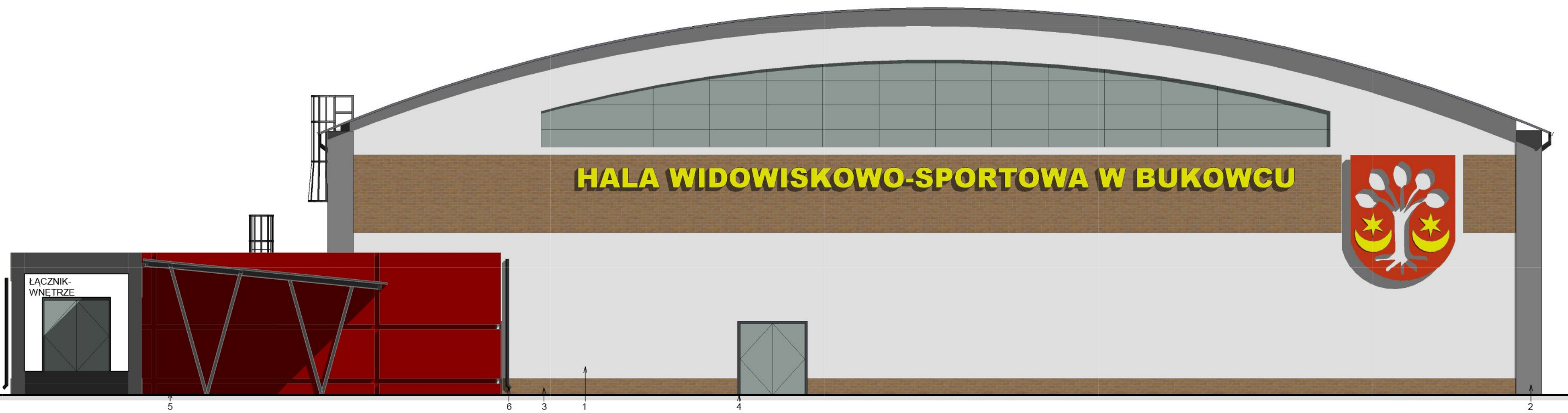
Elewacja pd-wsch. 1 : 100