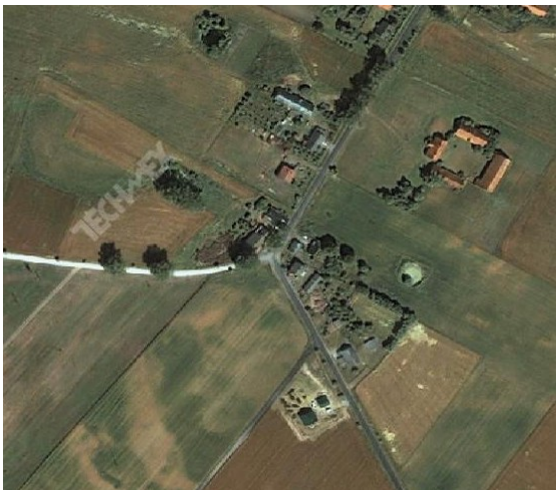
Fot. Zdjęcie satelitarne miejscowości Krupocin.

W zawartej poniżej analizie powierzchni odniesiono się do sołectw, ponieważ Gmina nie posiada informacji odnośnie powierzchni poszczególnych miejscowości, których w Gminie Bukowiec jest 16, a jedynie posiada dane dotyczące powierzchni sołectw (których liczba wynosi 13). W przypadku sołectwa Krupocin określono więc w poniższej tabeli zsumowaną powierzchnię dwóch miejscowości, wchodzących w jego skład, a mianowicie Krupocina i Franciszkowa.